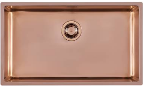
Évier KE Copper 2157 858