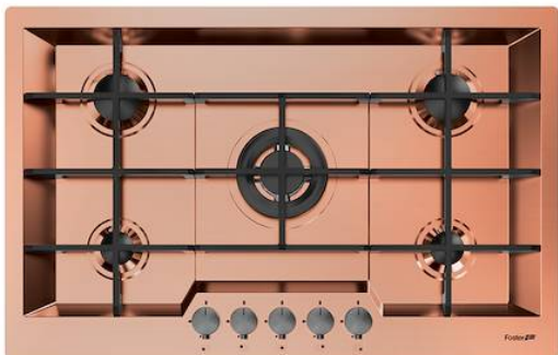
Table de cuisson KE Copper